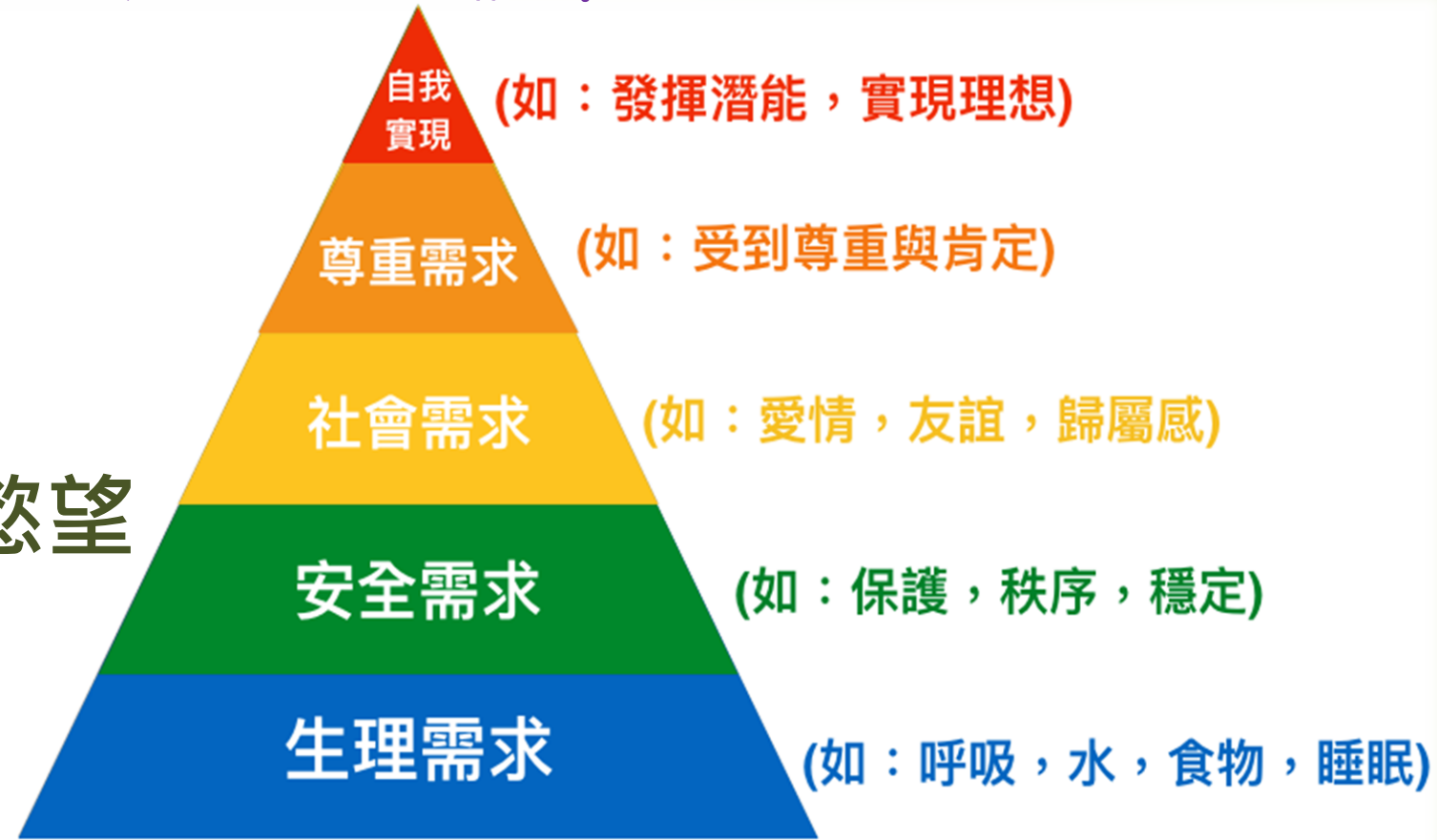
Maslow 需求層次理論 (1943年)